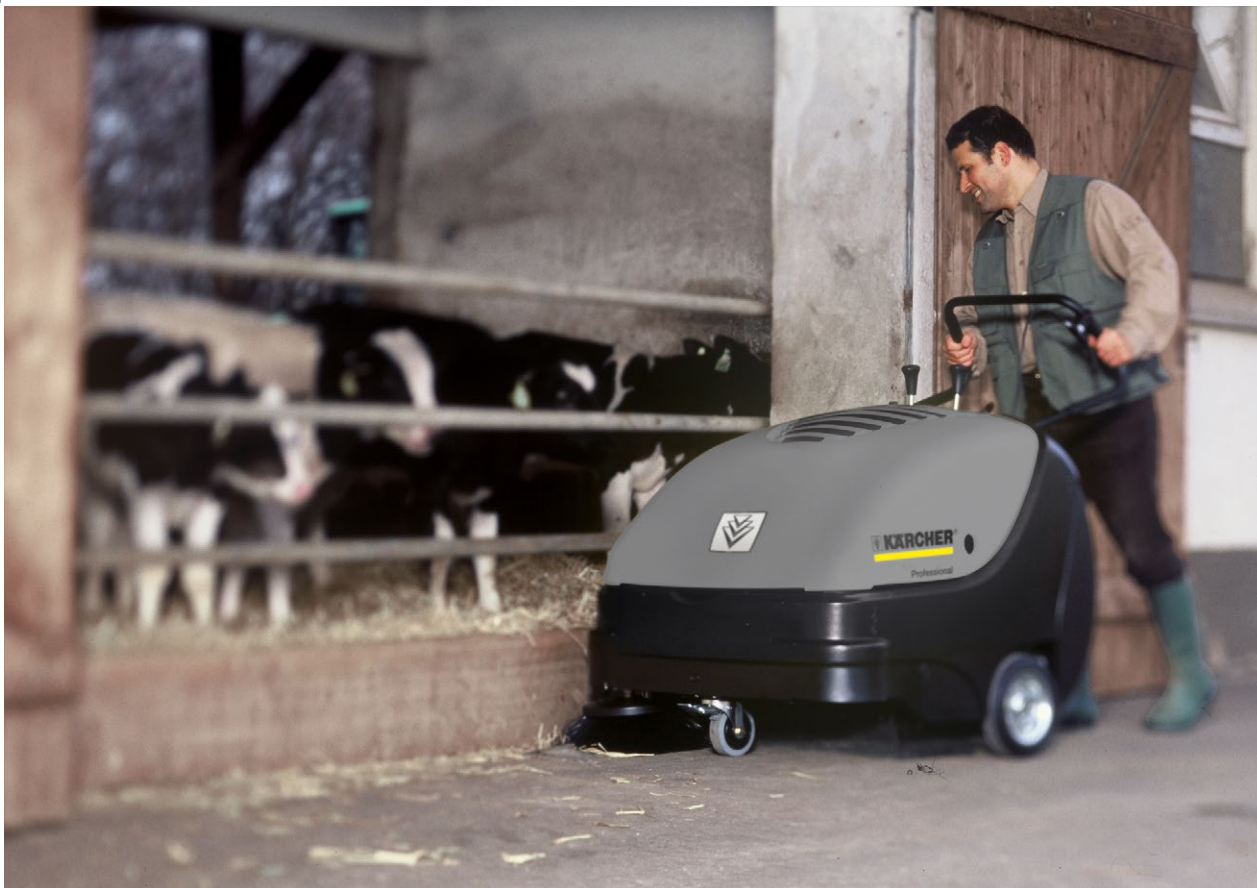
KM 85/50 W P