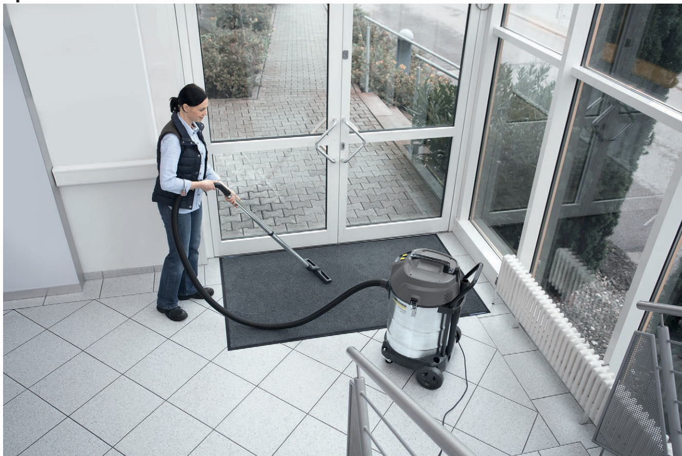
NT 70/2 Me Classic Edition