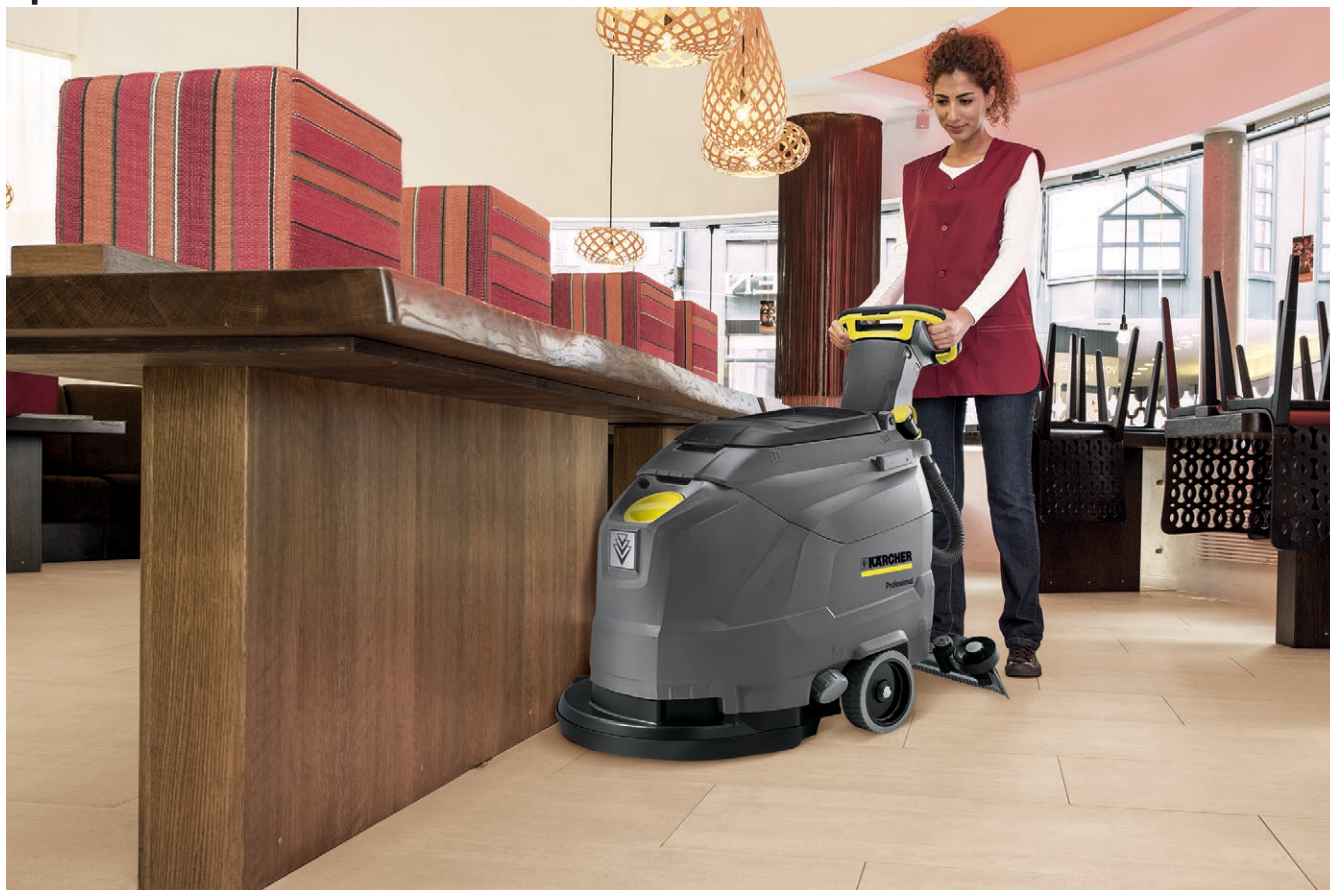
BD 43/35 C Ep