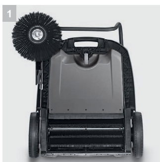
1 Привод цилиндрической щетки