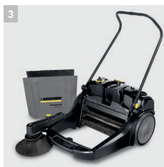
3 Большой контейнер для мусора