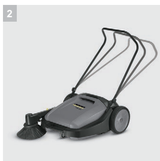
2 Регулируемая рукоятка