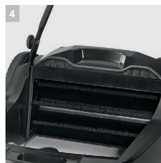
4 Фильтр для пыли